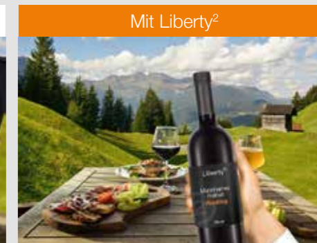
Scharf in der Nähe, Mitte und Ferne ohne Einschränkungen

Hinweis: Die Simulation dient ausschließlich der Veranschaulichung. Individuelle Seheindrücke können abweichen.