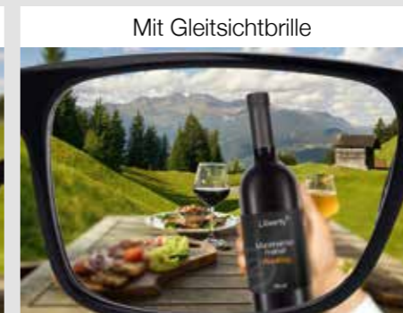
Scharf in der Nähe, Mitte und Ferne mit Einschränkungen in den Übergängen