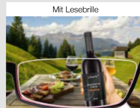
Scharf in der Nähe

Mit dem Zweilinsensystem Liberty 2 wird das scharfe Sehen in alle Entfernungen wieder ermöglicht. Bestehende Fehlsichtigkeiten wie Kurzsichtigkeit, Weitsichtigkeit oder eine Hornhautverkrümmung werden selbstverständlich mitkorrigiert. Die Einschränkungen des Sehens mit einer Brille entfallen.